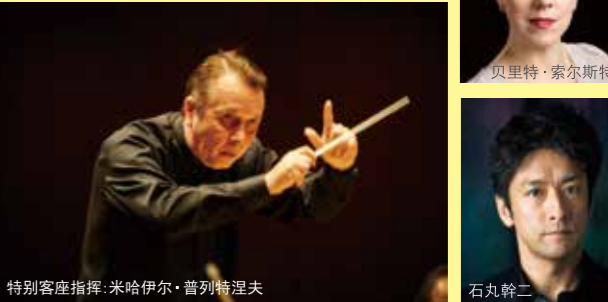
特别客座指挥:米哈伊尔·普列特涅夫

诞生于挪威的两大天才——格里格和易卜生。易卜生的剧作《培尔·金特》中讨论人生意义的故事和著名的天才作曲家格里格为这个故事谱写了精彩的乐曲,成为两大天才成功合作的一大杰作。在这个作品中有众多的亮点,将交响乐队和合唱的威力发挥到极致。本次公演将安排一般演出比较少见的“全曲演奏”。相信易卜生杰作和格里格名曲将给您带来深刻的印象。