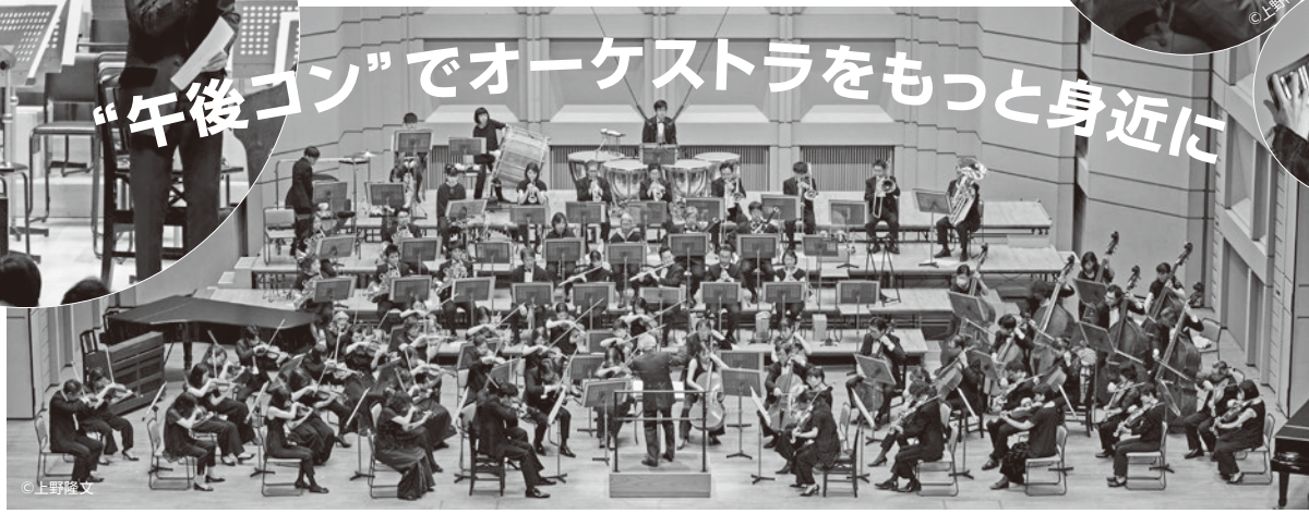
※Bunkamuraは隣接地の再開業に伴い、2027年度中まで休館を予定しておりますが、オーチャードホールは日曜・祝日を中心に限定営業となります。