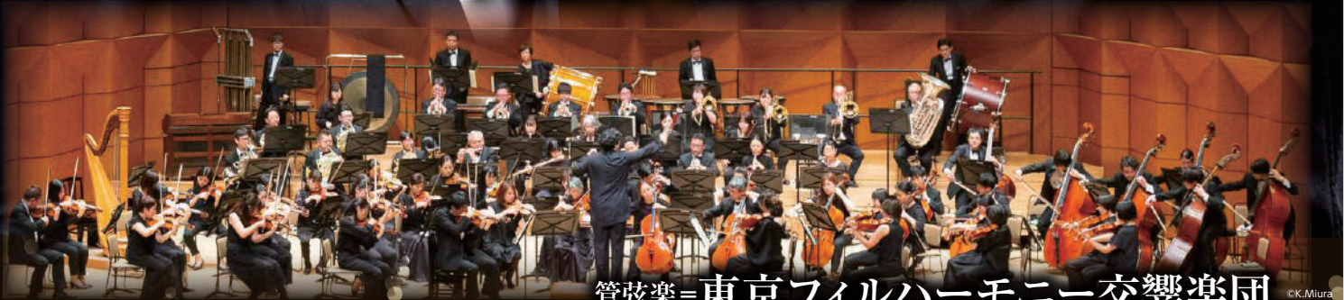
管弦楽=東京フィルハーモニー交響楽団

ラフマニノフ／ピアノ協奏曲第3番* ラヴェル／道化師の朝の歌(管弦楽版) ラフマニノフ／ヴォカリーズ ラヴェル／ボレロ